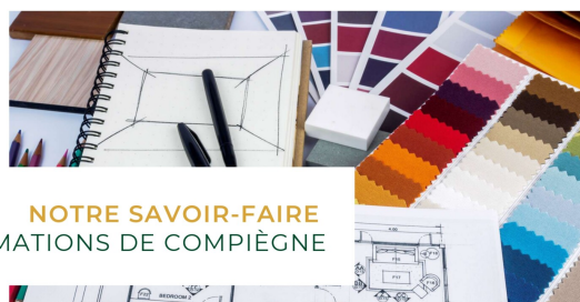
NOTRE SAVOIR-FAIRE LES TRANSFORMATIONS DE COMPIÈGNE