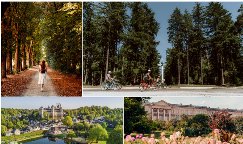
© Forêt – Elsa&Cyril / A vélo sur l'EV3 – Hilde LENAERTS / Pierrefonds – Shutterstock / Château de Compiègne – Elsa&Cyril

Cette proximité entre les 2 châteaux permet aux visiteurs de séjourner sur les 2 territoires sans faire cas des limites administratives, les 2 Offices de Tourisme (Agglomération de la Région de Compiègne et Pierrefonds-Lisiers de l'Oise) travaillent donc conjointement sur la création d'offres, dans une logique de renvoi et de promotion mutuelle systématique. Par ailleurs, la CCPE qui représente l'aspect plus champêtre de la destination, bénéficie pleinement du rayonnement de Compiègne- Pierrefonds et offre des activités nautiques et de baignade, ainsi que la visite d'un ancien site industriel.